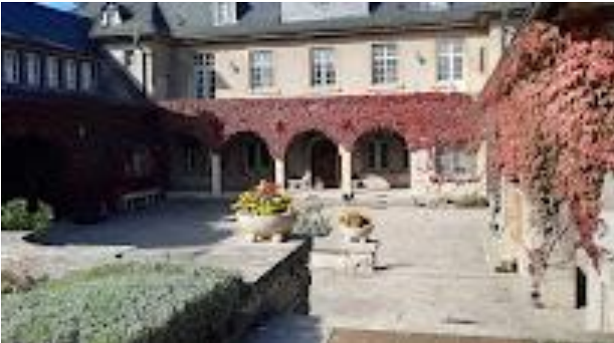
Saalfeld/Saale, Villa Bergfried – Auf Hüther's Spuren